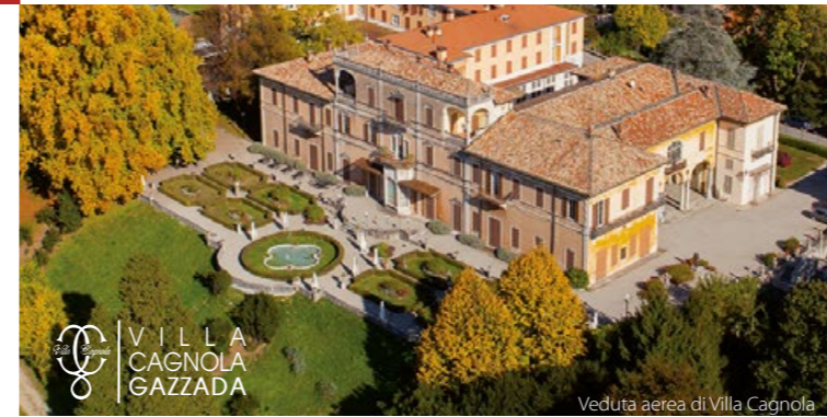
VILLA CAGNOLA GAZZADA